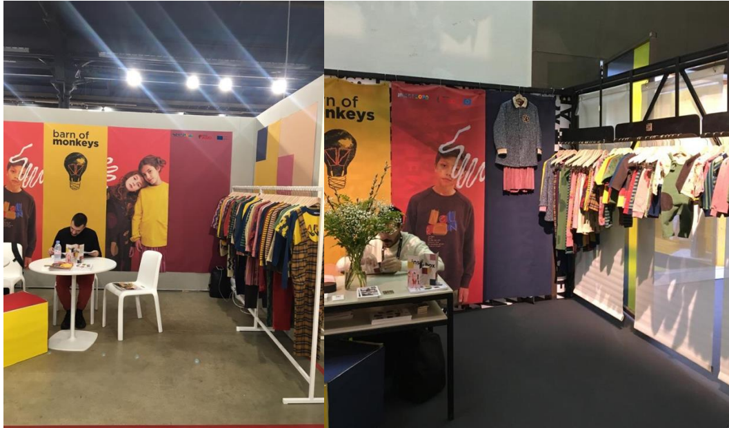
Figura 3 PLAYTIME NEW YORK AW19