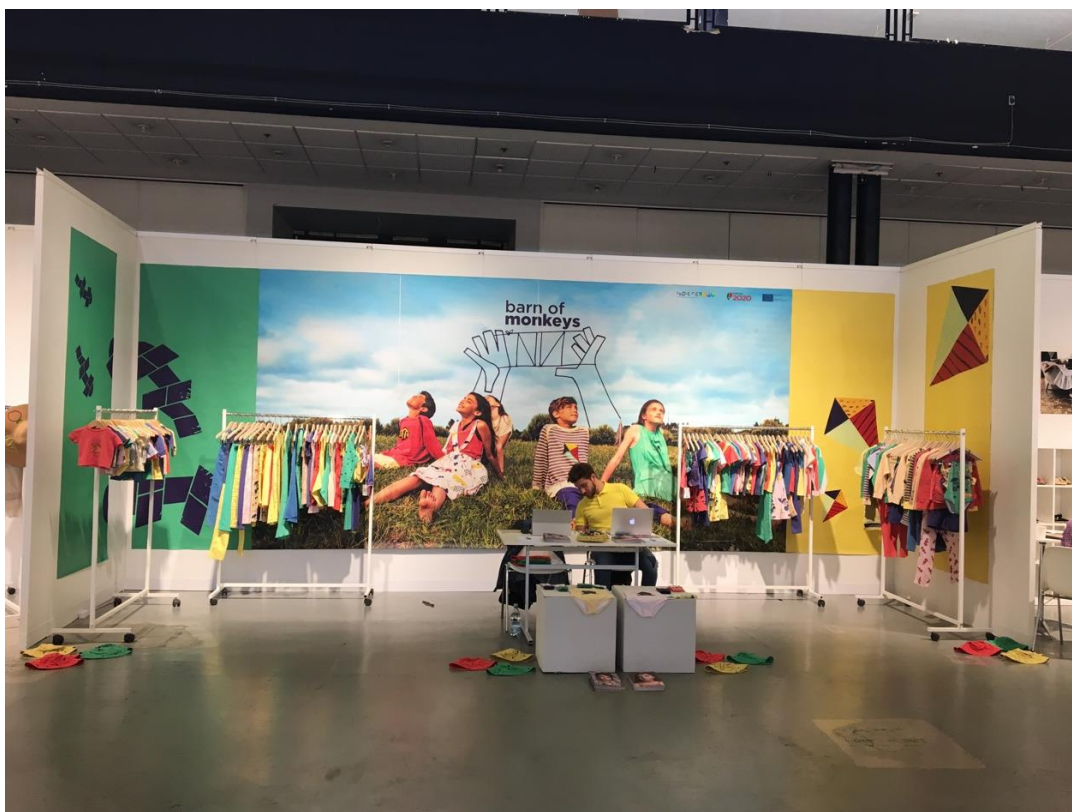
Figura 2 CIFF SS19