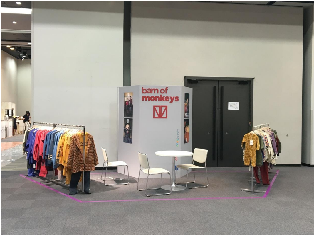
Figura 1 PLAYTIME TOKIO AW18