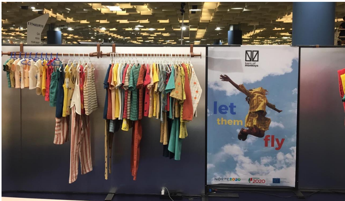
Figura 4 PITTI BIMBO SS20